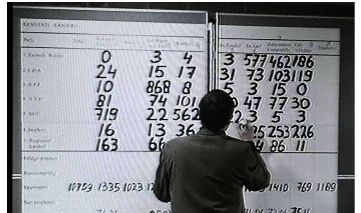
^ De uitslagen van de verkiezingen in de Phoenix in Schaijk worden met een viltstift op een bord geschreven.