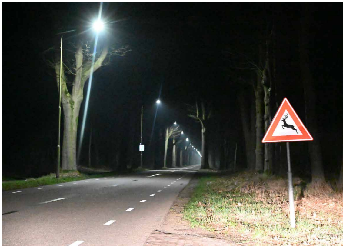
^ De verlichte Corridorweg met de lantaarnpalen van Chris School.