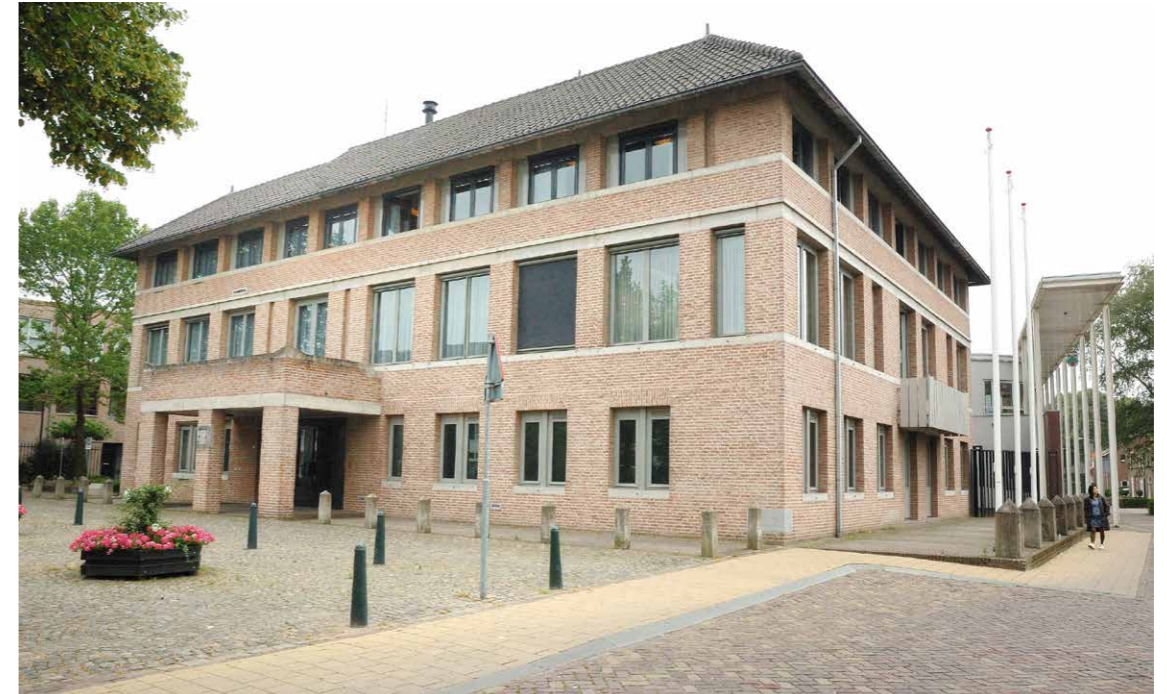
^ Gemeentehuis Zeeland.

In een brochure die de gemeente in de week voor de opening huis aan huis verspreidt, noemt de Stichting Jong Landerd het verbindingsstuk tussen het oude gedeelte en het U-vormige nieuwe gebouw een 'pergola'. En oud-wethouder en raadslid Gerard Engbers laat in de brochure doorschemeren dat beide gebouwen absoluut niet bij elkaar passen. "Oud- en nieuwbouw van het gemeentehuis zijn twee aparte stijlen. Ik vind het afbreuk doen aan het oude gebouw dat ik erg mooi vind."